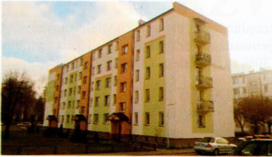
Budynek przy ul. Nidzicka 11