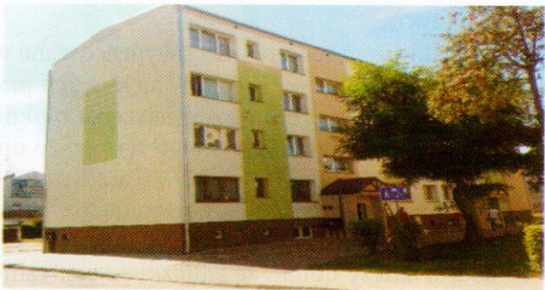
Budynek przy ul. Łąkowej 6