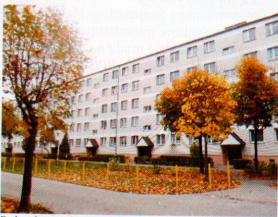
Budynek przy ul. Norwida 3 przed termomodernizacją

Spółdzielnia pomimo, że nie ma wpływu na ceny taryf ciepła ustalone przez Przedsiębiorstwo Ciepłownicze dla miasta Działdowa, znacząco wpływa na zmniejszające się koszty centralnego ogrzewania poprzez monitoring generowanego zużycia (za pomocą zdalnego sterowania temperaturą centralnego ogrzewania i ciepłej wody) oraz termomodernizacji budynków.