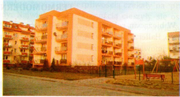
Budynek przy ul. Leśnej 9A