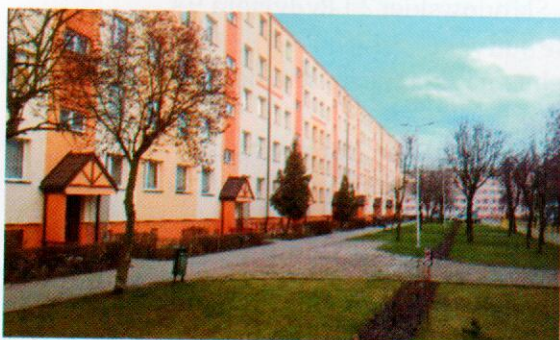
Budynek przy ul. Norwida 3 po termomodernizacji