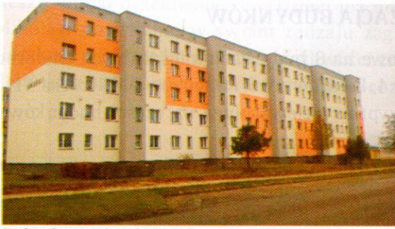
Budynek przy ul. Rydygiera 5